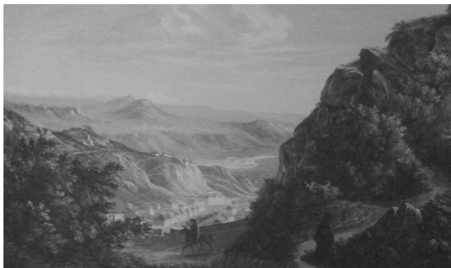
М.Ю. Лермонтов. Вид Пятигорска. 1837–1838 гг.