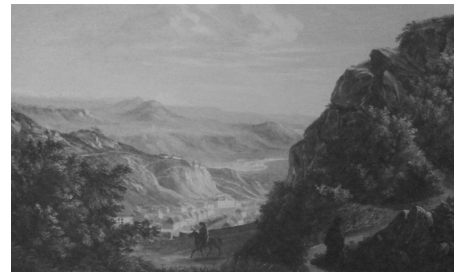
М.Ю. Лермонтов. Вид Пятигорска. 1837–1838 гг.