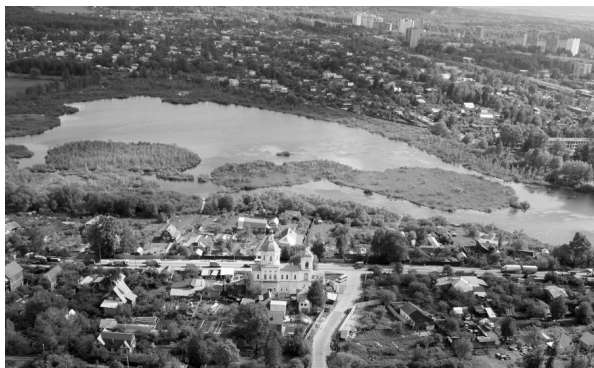
Современная фотография озера Киёво

2 Выберите одну из предложенных тем для подготовки монологического высказывания.