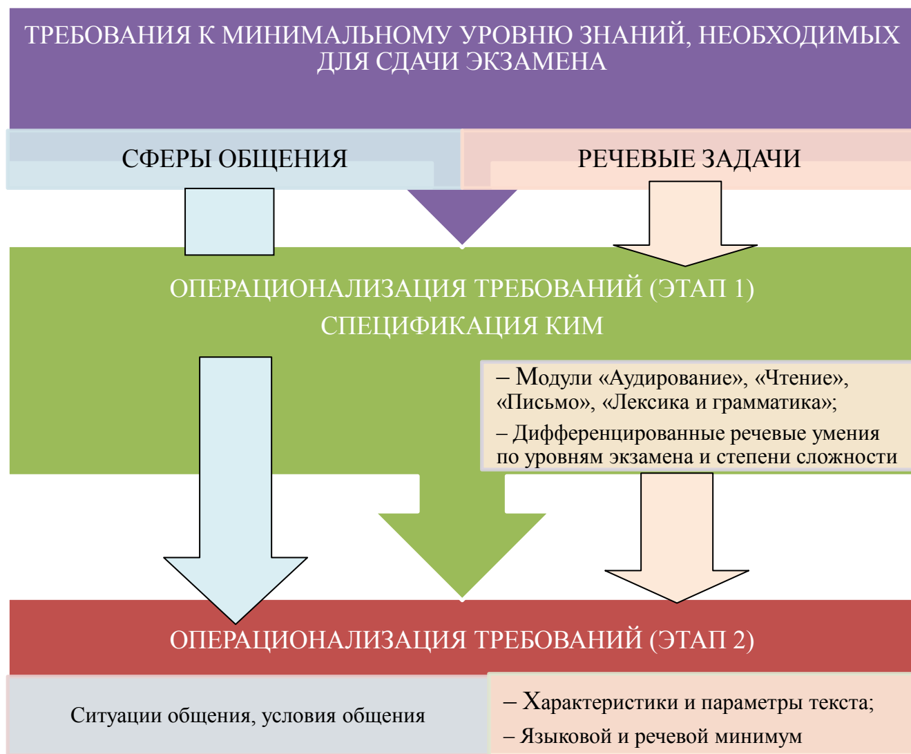
Рис. 2. Операционализация требований. Этапы