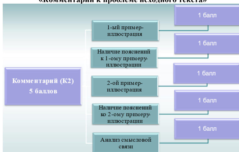
Схема подсчёта баллов по критерию К2 «Комментарий к проблеме исходного текста»