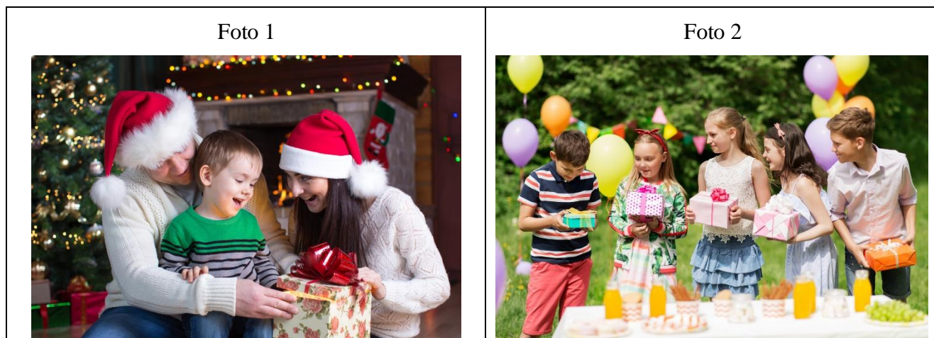
Таблица 17. Дополнительная схема оценивания задания 4 «Fiestas y celebraciones» (задание 15 пособия)

Recuerde que sólo tendrá 3 minutos para hablar (12–15 frases). Debe hablar de manera continua.