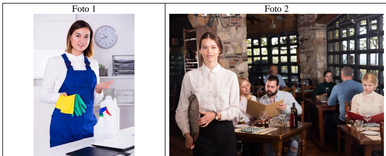
Таблица 15. Дополнительная схема оценивания задания 4 «Фото к проектной работе»

Recuerde que sólo tendrá 3 minutos para hablar (12–15 frases). Debe hablar de manera continua.